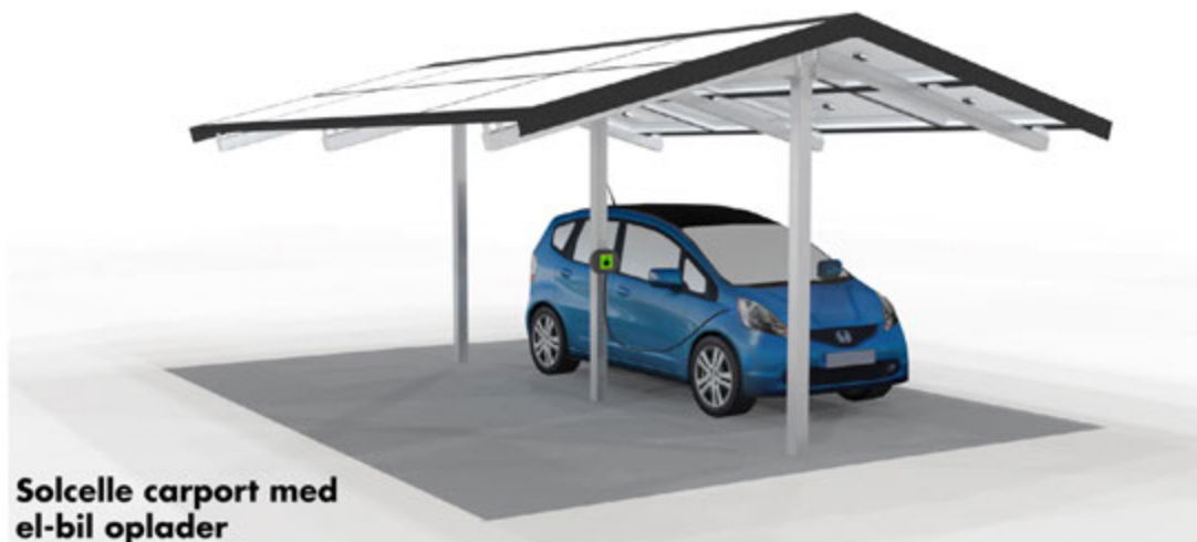
Solcelle carport med el-bil oplader